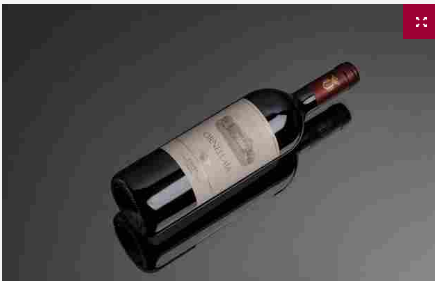
L'Ornellaia 2012 (Frescobaldi) è il "Red wine of the Year" 2022 per "Decanter"