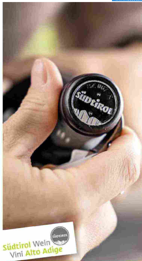
IDM/SÜDTIROL WEIN/MINT MEDIAHOUSE

Blend di uve Sangiovese provenienti dal vigneto Ribaldoni di Villa Rosa nel Chianti, e uve Merlot, che invece arrivano da Poggio La Mozza, Tenuta Val delle Rose in Maremma, Coevo, con l'annata 2021 si fa ancora più prezioso: ne sono state prodotte solo 3 mila bottiglie, oltre a 300 magnum. Contemporaneo ed equilibrato, ha tannini setosi in pendant con la componente acida. (cecchi.net)