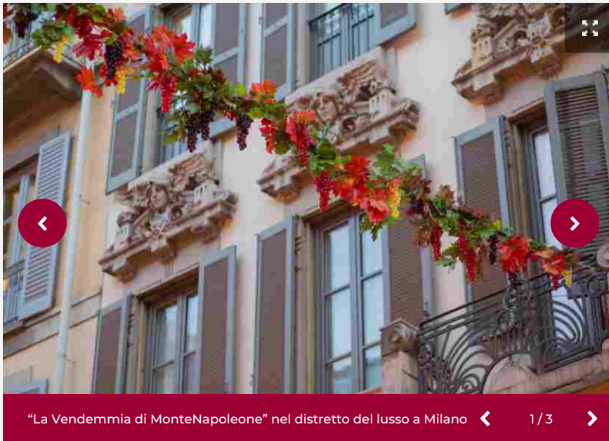
"La Vendemmia di MonteNapoleone" nel distretto del lusso a Milano 1/3

Esperienze sensoriali d'eccezione, menu gourmet nei ristoranti più prestigiosi, una mostra fotografica a cielo aperto di Sebastian Copeland ed esclusivi eventi nelle