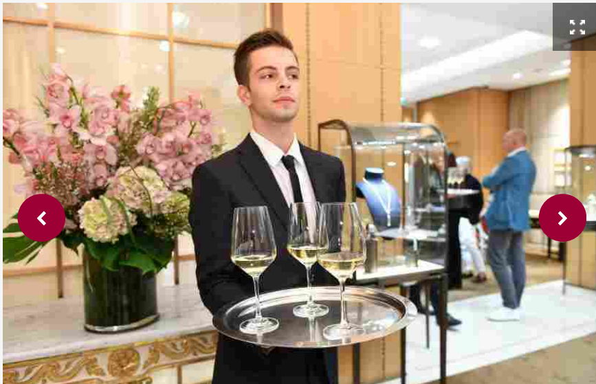
Vino & moda nelle boutique di Milano